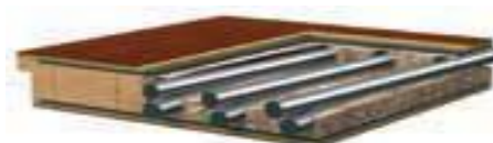
Řez křídlem Granit