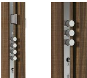
Vícebodový lištový zámek

Profil hrany – obě boční a horní hrana jsou oplepeny okrajovou páskou ABS nejvyšší jakosti, která je velmi odolná proti mechanickému poškození.